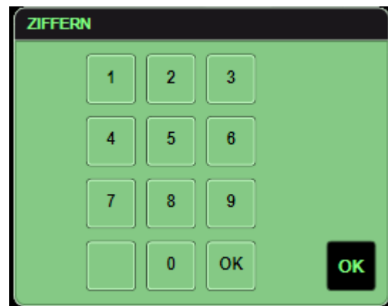
Abb.3 Ansicht PopUP rechts