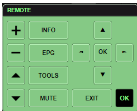
Abb.2 Ansicht PopUP links